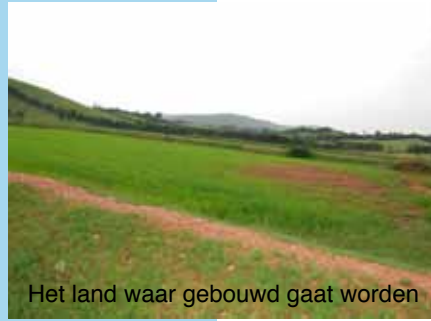
Het land waar gebouwd gaat worden